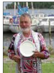
Min far - og en madskål.