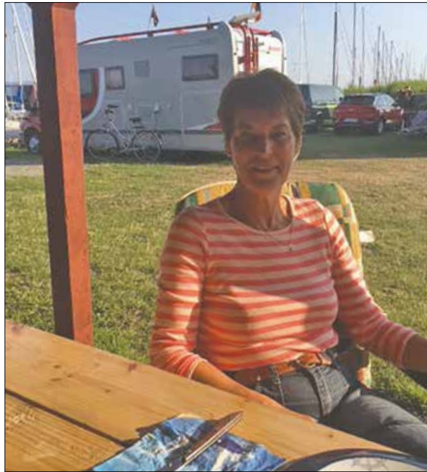
Klar til aftensmad i Kloss Hafen i Zingst.