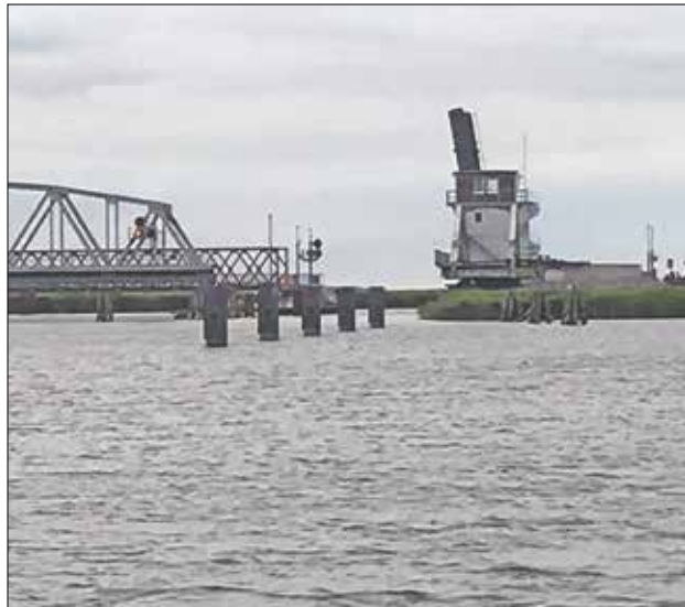
Meiningen Brücke vest for Zingst.

på restaurant for at spise aftensmaden. Vi valgte begge vores favorit ret – Scholten art Finkenwerter. Stegt rødspætte med brasede kartofler og skinke skåret i tern. Den kan virkelig anbefales – Uhm.. Efter spisningen blev vi siddende, og over endnu et glas vin og kaffe heppede vi på Danmark i den spændende kamp mod Kroatien. Kampen endte 1-1 – forlænget spilletid uden scoringer, og så ud i straffespark. ØV ØV – Danmark brændte to – Kroatien videre i VM turneringen. En fantastisk aften med drama til det sidste.