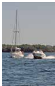
Speedbådsfører, som nok kunne trænge til et kursus. (Arkivfoto).