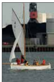
Sejlklubben "Frem's" skolebåd med instruktør og elever. (Arkivfoto).