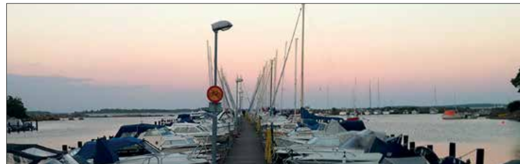
Broen i Svanevik.

havn, og her var der flere skibsstyrs forretninger, så vi købte et sæt bedre kort til skærgården. Dieselen blev hentet, og kl. 10:50 sejlede vi mod Karlskrona. Vi ville ud at ligge ved en ø eller for svaj.