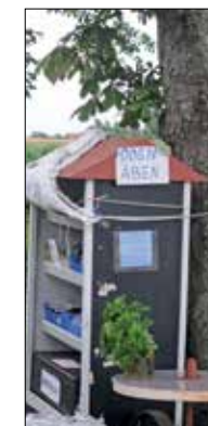
Femø vrirler med sære og interessante ting langs veje og stier.