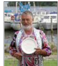
Min far - og en madskål.

det op og kravle under. Jeg tog turen to gange. Men de kender mig. Så jeg blev båret hjem igen hver gang, og hegnet blev sat fast, så jeg ikke kan hive det op. Genboens kat har jeg også fulgt hjem, her sluttede det under deres bil, min far og mor kom og hev mig ud.