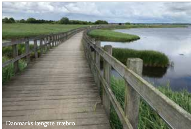
Danmarks længste træbro.