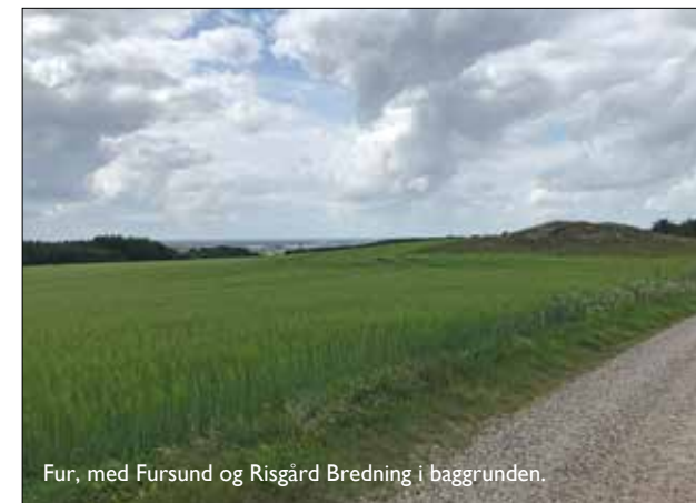
Fur, med Fursund og Risgård Bredning i baggrunden.

Thyborøn kan rigtig godt anbefales at tage til, det er en fin by, herude mellem Vesterhavet, Thyborøn kanalen og Limfjorden. Det er forhåbentlig ikke sidste gang, vi kommer her.