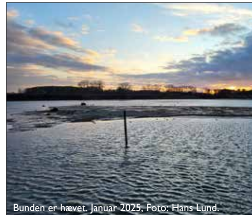
Bunden er hævet. Januar 2025

Bestyrelsen var enig om at det var boreslam fra brobyggeriet, som Banedanmark var i gang med. Der har kun været et uddybningsfartøj i forberedelsesfasen med en pram. Ved de efterfølgende borer er boreslammet spulet ud i Guldborgsund og det er dokumenteret ved foto. SIG har tidligere rettet henvendelse og ikke fået konkret svar på, hvor boreslammet