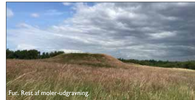
Fur. Rest af moler-udgravning.