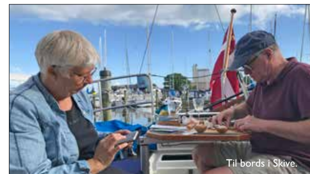
Til bords i Skive.