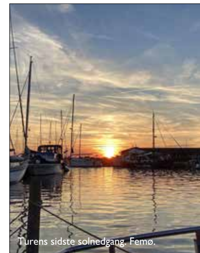
Turens sidste solnedgang. Femø.