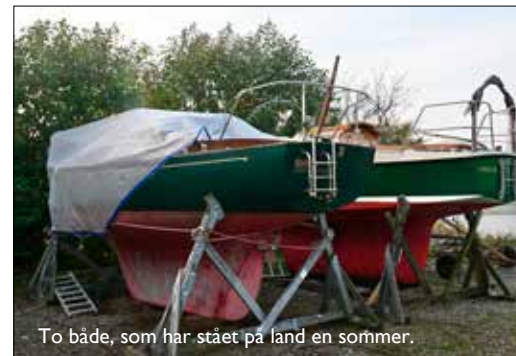
To både, som har stået på land en sommer.