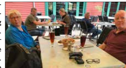
Belønning for lang cykeltur på Fur.

Næste morgen den 23. juni sættes kursen mod Lemvig, 18,5 sømil mod vest. Klokken er 9.45 og solen skinner, og sejlene sættes. Vi tager lige et par slag, og så holder vi højde forbi Venø-færgen. Sejlene bliver på op gennem Venø sund. Da vi nærmer os Oddesund broen, tager vi rullefokken ind, og starter motoren. Broen åbner kl. 11.15 ifølge "Havne-lodsens". Desværre vidste de ikke det på