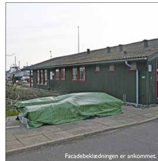
Facadebeklædningen er ankommet.