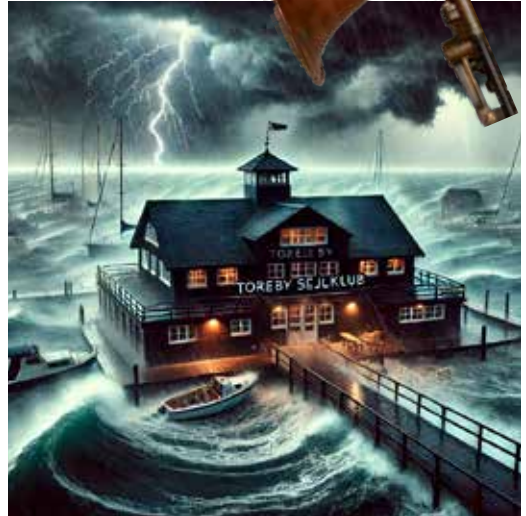
ChatGPT's billede af "Storm over Toreby Sejlklub".