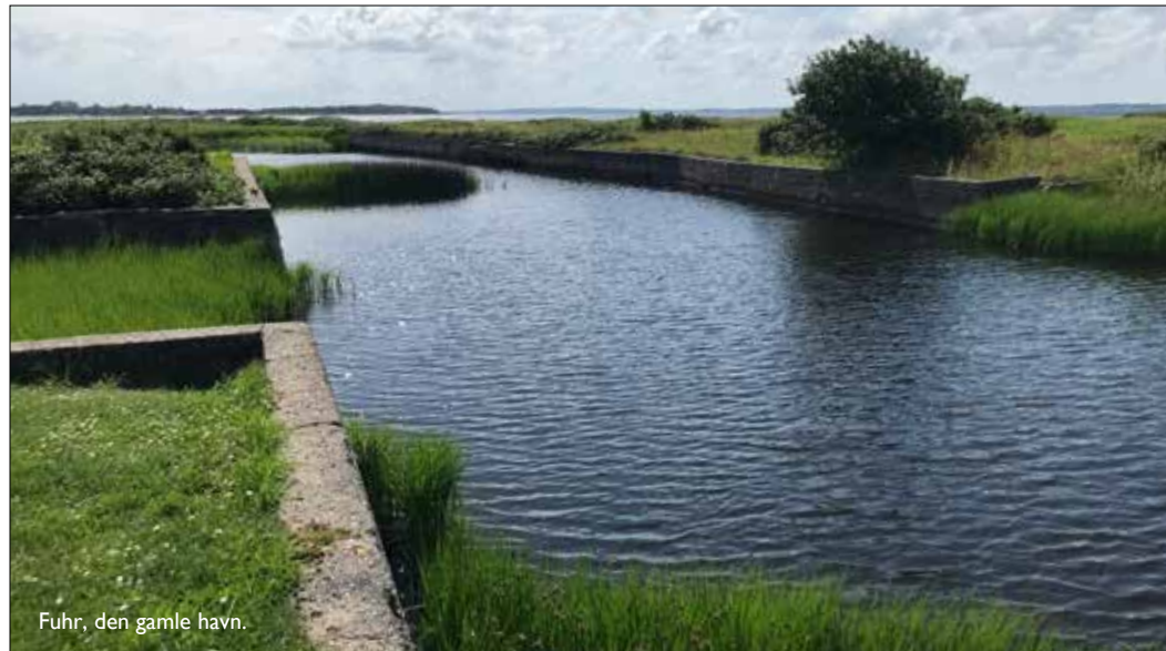
Fuhr, den gamle havn.

Vejen tilbage til båden går forbi "Johnny Madsen vej", "Sneglehuset", skamstøtten, og ned på stranden. Senere går vi tilbage på vejen, men forbi mindeparken for historiens største søslag "Slaget ved Jylland i 1916", mellem England og Tyskland. I klitterne er der sat store støtter