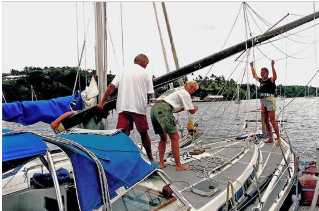
Med masten liggende på dækket sejlede vi ind mellem to sejlbåde, og med fald fra deres master fik vi vores mast rejst og forsvarligt fastgjort, og pludselig var Circe igen en sejlbåd.