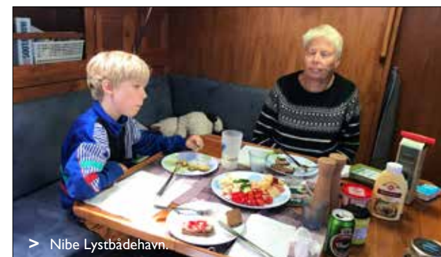
> Nibe Lystbådehavn.