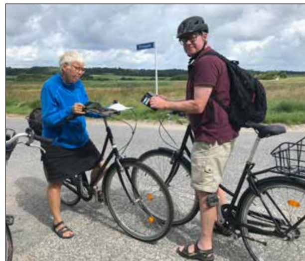
Cykeltur på Fuhr.

21. juni årets længste dag. Lidt vemodigt at tænke på, at nu går det mod de mørke