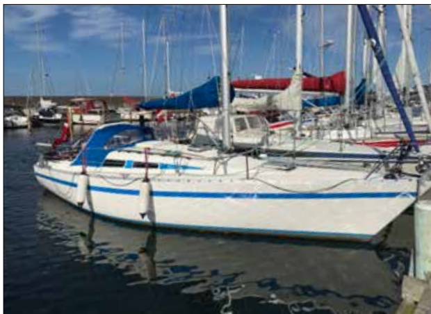
Herunder: Øster Hurup Havn.

strøm. 15.50 passerer vi Als Odde og sejler ud i renden. Herefter sættes kursen mod Grenå. Fed sejlads for sejl det meste af vejen. Kl. 21.15 har vi forløjet i Grenå Havn efter 57.8 sm. Vi fandt en god plads et stykke inde i havnen i læ. Stævnen mod øst og cockpittet mod vest. Nu er der chancer for sol det meste af dagen.