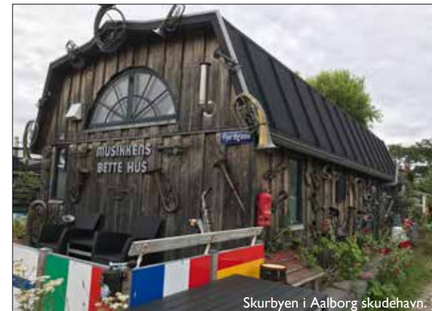
Skurbyen i Aalborg skudehavn.